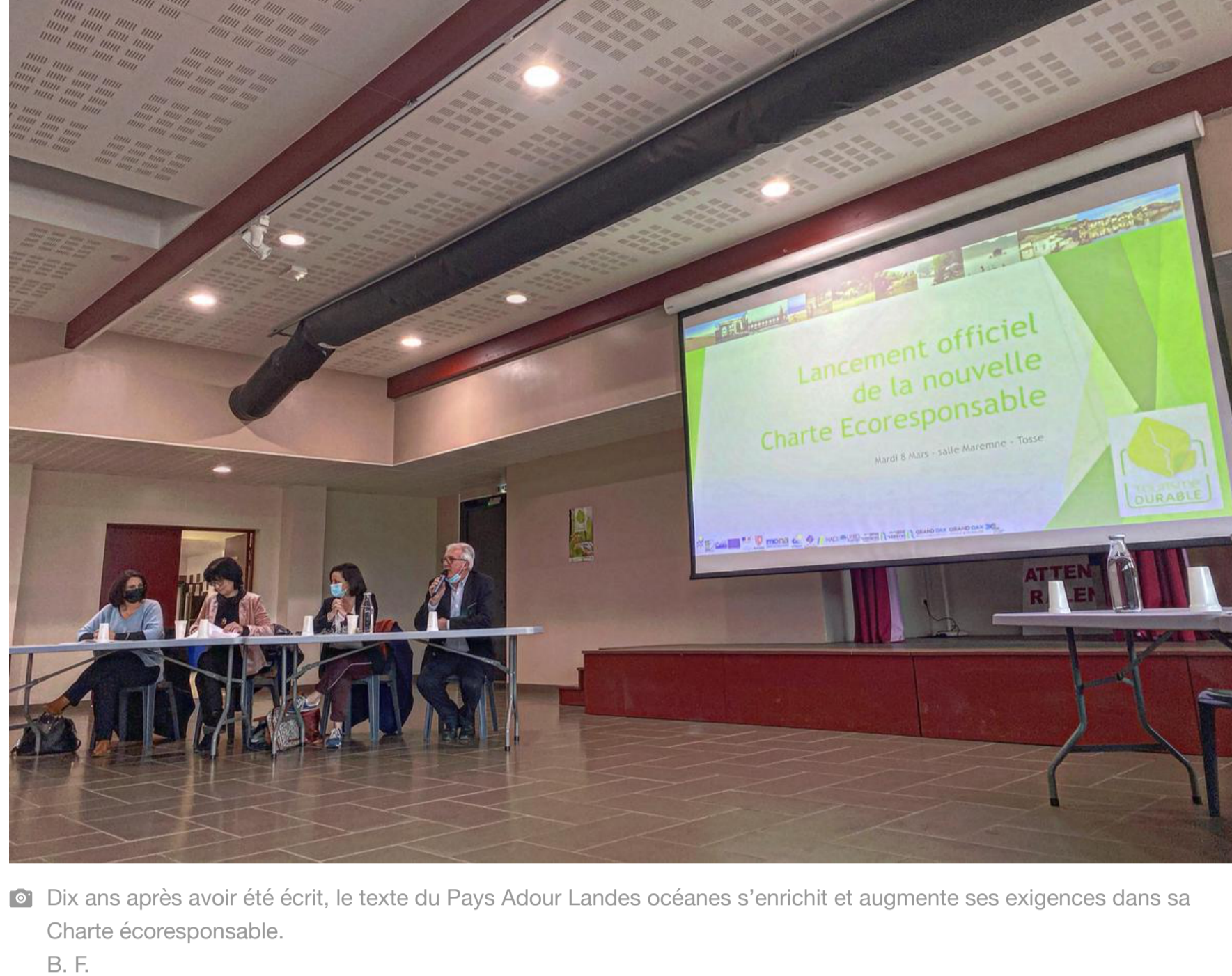
Dix ans après avoir été écrit, le texte du Pays Adour Landes océanes s'enrichit et augmente ses exigences dans sa Charte écoresponsable. B. F.

Refondé, durant les derniers mois, afin d'être présenté aux Rencontres du tourisme durable – à Tosse, ce mardi 8 mars – le texte a convaincu, une décennie plus tard, 58 professionnels, interlocuteurs privilégiés des quatre offices de tourisme intercommunaux du sud des Landes, ainsi que de ceux d'Hossegor et de Ségnosse.