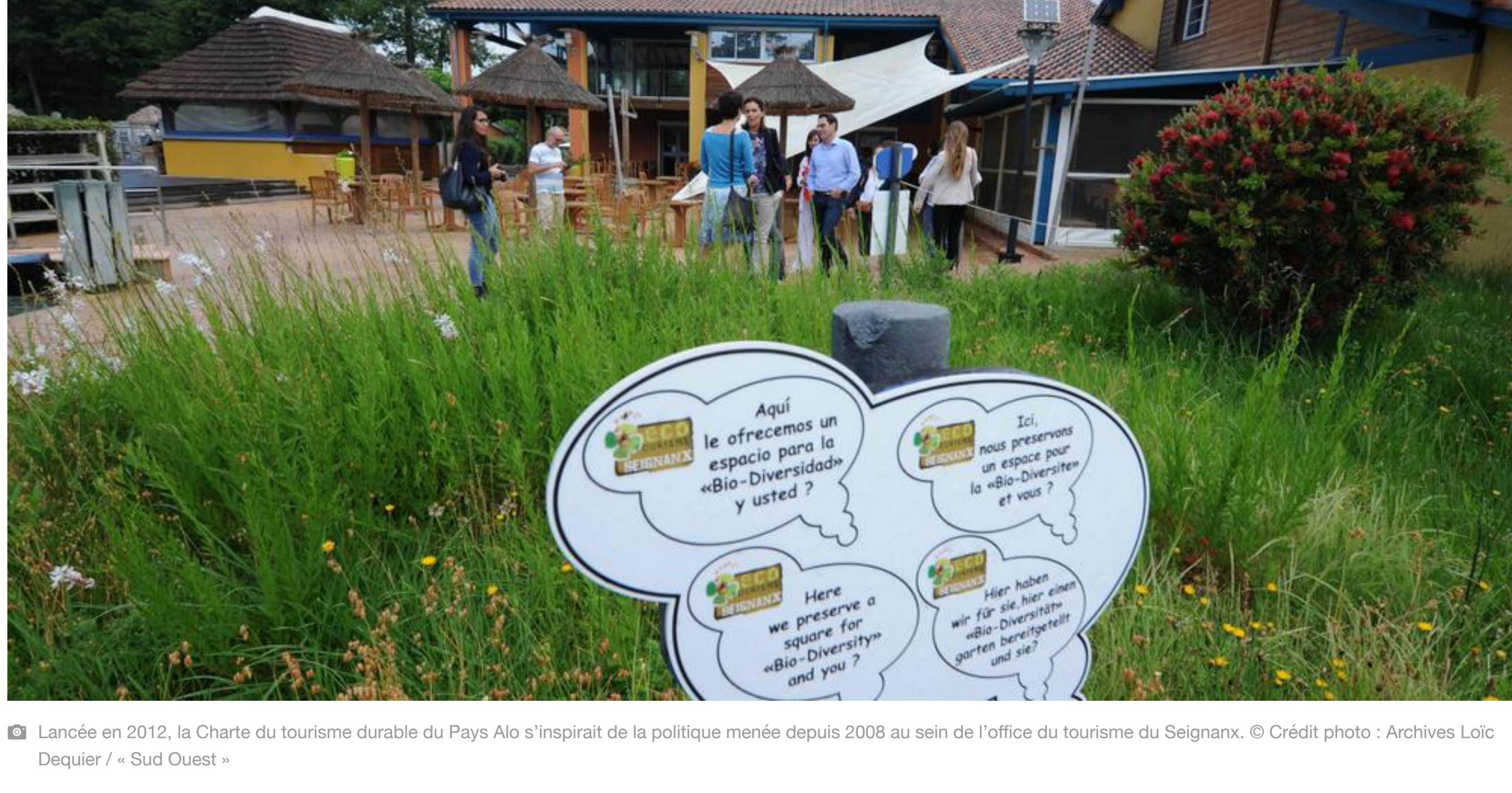
Lancée en 2012, la Charte du tourisme durable du Pays Alo s'inspirait de la politique menée depuis 2008 au sein de l'office du tourisme du Seignanx.

Accueil • Tourisme • Tourisme Dans Les Landes